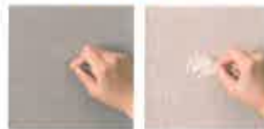
スーパー耐久性タイプ 一般ビニル壁紙

今ある窓の内側に取り付けることで空気層が障壁となり、防音効果を発揮。愛犬の鳴き声が外部に漏れるのを軽減します。また外部の騒音を防ぎ、静かな室内環境を作ることで愛犬のストレスを軽減します。